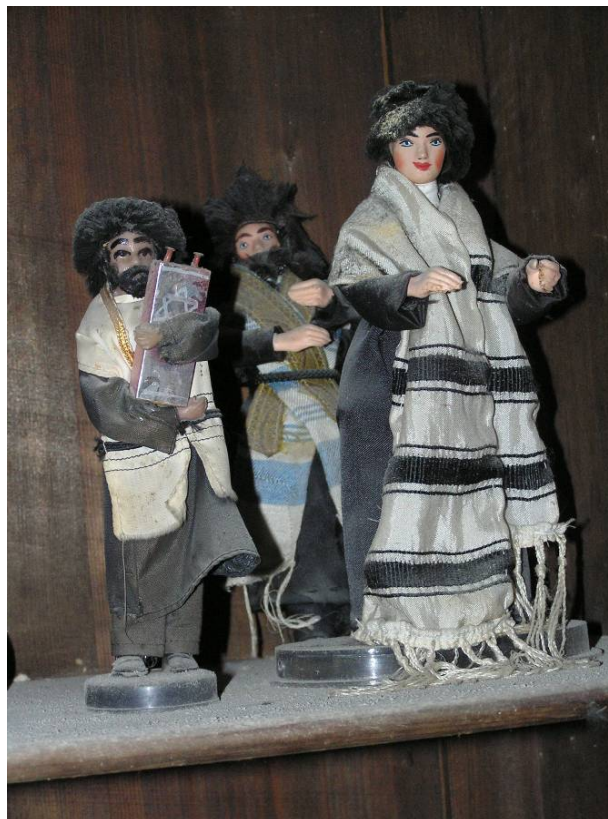
בובות 'חסידיות' שנמצאו בבית הכנסת חברת ג"ח

במרץ 1949 הוציאו השלטונות את הפעילות הציונית אל מחוץ לחוק והחלו לבצע מעצרים של פעילים ציוניים. כתוצאה מכך, חלק מהארגונים היהודיים ירדו למחתרת (דוגמת בית"ר).